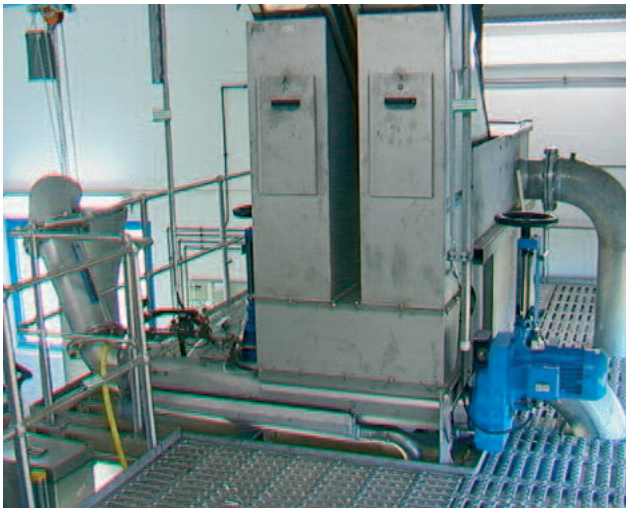
Välpeen voi purkaa laitteeseen eri tavalla