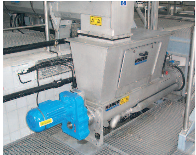
WAP Välpeenpesuri käsittelee välpeen luotettavasti