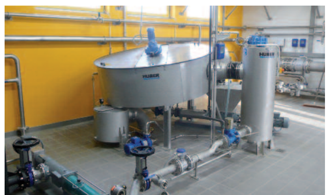
Suodattimen puhdistus ilman ulopuolelta tulevaa pesuvettä