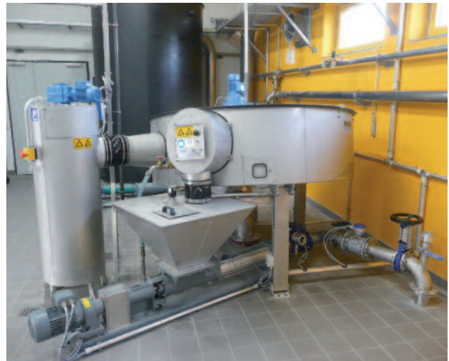
ROTAMAT® RoS 2S levytiivistin suunniteltu 35 m 3 /h