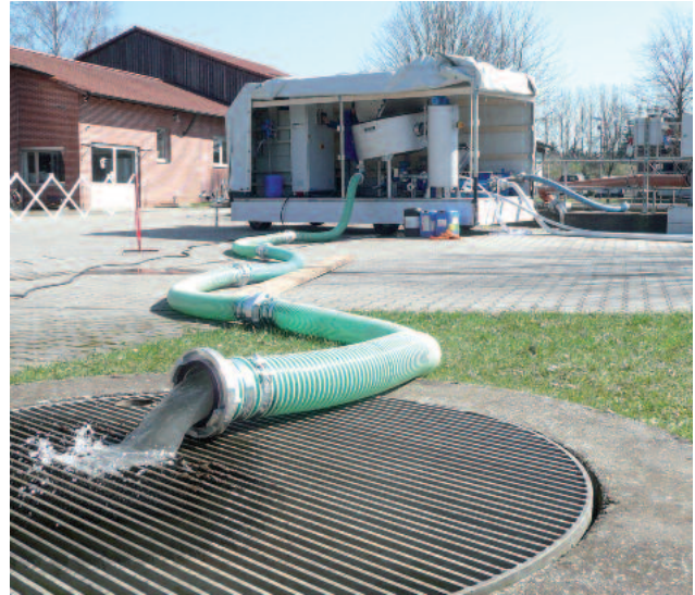
ROTAMAT® RoS 2S levytiivistin asennettu auton perävaunuulle