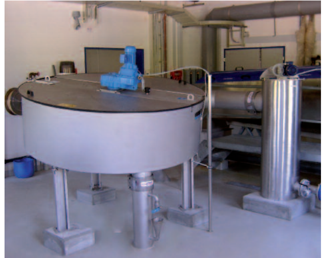
ROTAMAT® RoS 2S koko 2 levytiivistimen kiinteä asennus