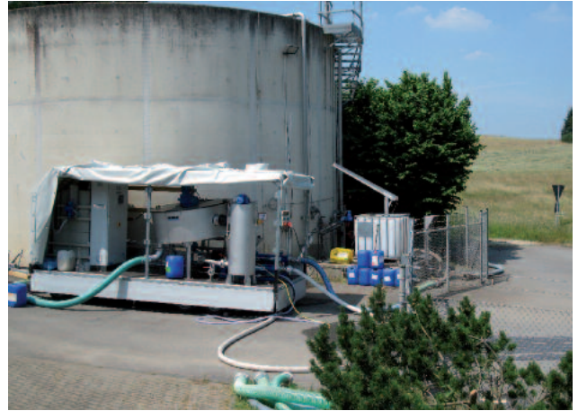
Alustalle asennettu ROTAMAT® RoS 2S levytiivistin lietteen tilavuuden pienentämiseen