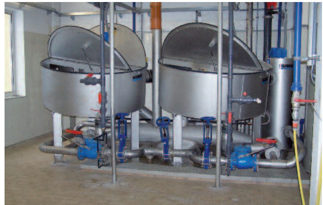
Kaksi laitetta asennettu hyvin rajoitettuun tilaan