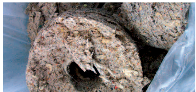
Pesty ja kuivattu välpe - ihanteellinen polttoaine

Välpeen kuiva-ainepitoisuus, WAP mallista riippuen: aina 50% TS asti..