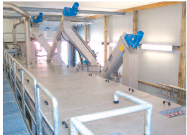
Suljettu, hajuton välpeen poisto ROTAMAT® Ro5 kompaktilaitteesta