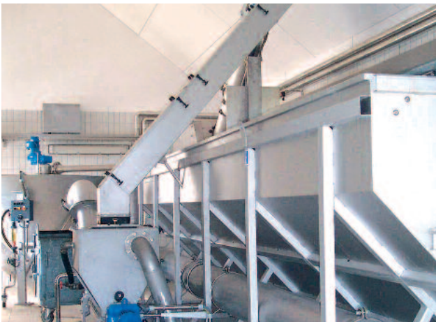
Tehokas välpeenpesu WAP/SL välpeenpesurissa, ROTAMAT® Ro 5 kompaktilaitteen jälkeen