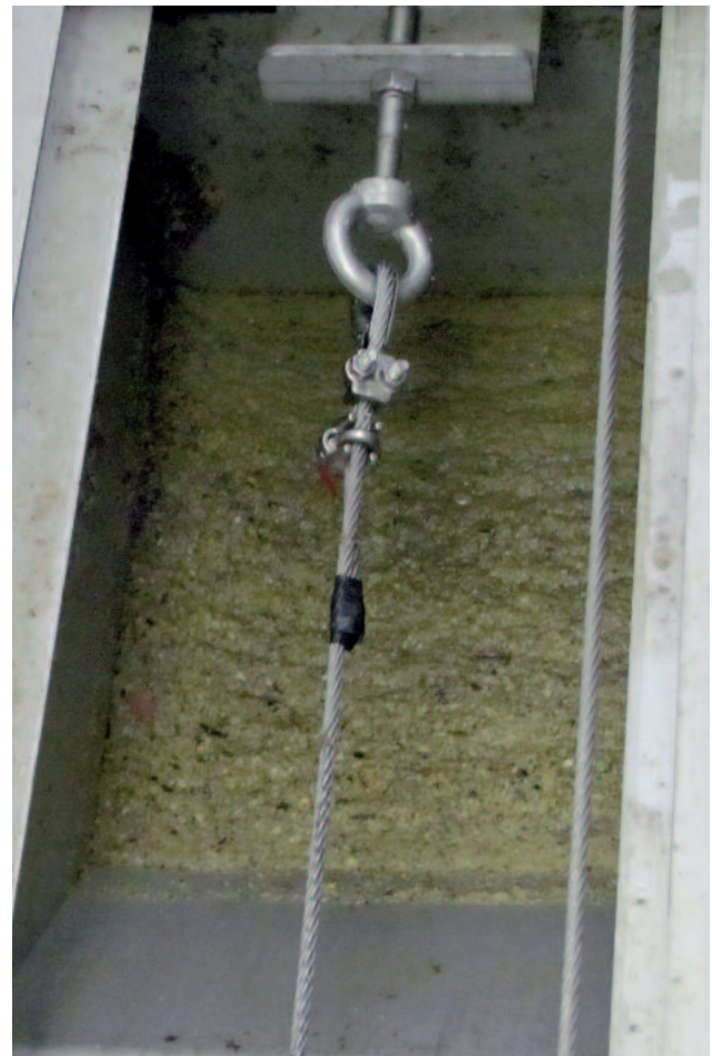
Rasvanerotusaltaan rasvapoistokaavin. Samalla periaatteella kun pitkän altaan hiekanpoistokaavin toimii, työntää rasvakaavin kelluvan rasvan pumppu-syvennykseen.

Laitteemme eroaa kilpailijoiden samankaltaisista laitteista siinä, että kelluva rasva ja öljy kuoritaan pois veden pinnalta hitaasti liikkuvan, ruostumattomasta teräksestä valmistetun vaijerin avulla vedettävän, laahaimen avulla. Laahain on muotoiltu niin että se poistaa näennäisesti kaiken kelluvan aineksen rasvanerotuksesta. Tällä tavalla estetään rasvan ja öljyn anaerobinen hajoaminen ja epämiellyttävät hajuhaitat poistuvat.