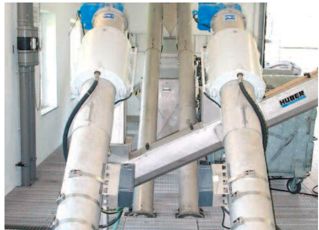
Maan alle asennettu ROTAMAT® Ro5 kompaktilaitte