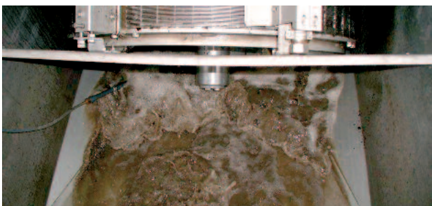
Erinomainen välppä ROTAMAT® Ro 2 hienovälppä pyörivällä seulakorilla

Muita seulan kokoja voidaan tarjota pyydettäessä. Välpille ja WAP välpeenpesurille löytyy omat esitteet.