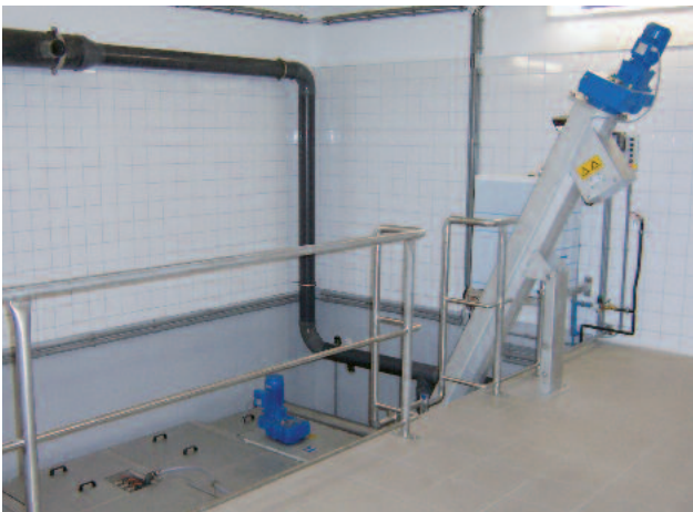
Sisäänrakennettu hiekan pesu ROTAMAT® Ro5 kompaktilaitteen loppupäässä.