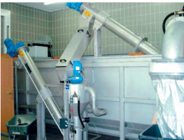
Lajitinruuvi, jonka alla HUBER RoSF4t/C kuivan hiekan pesuri

Erotettu hiekka valuu poistokaukaloa pitkin HUBER RoSF4/t hiekan pesuriin.