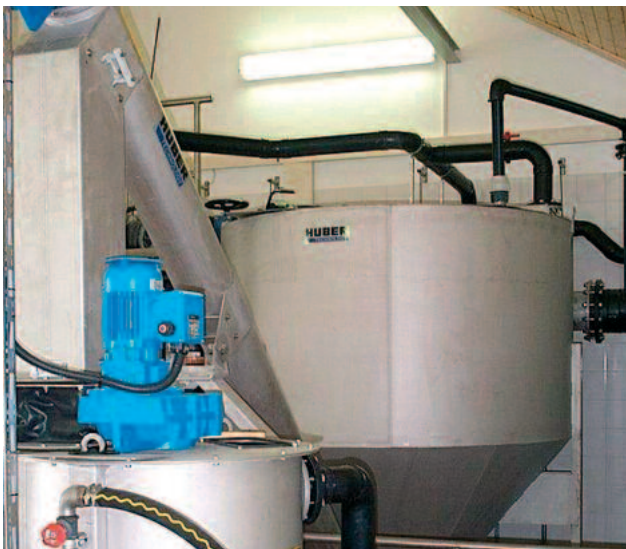
HUBER Pyöreä hiekanerotin HRSF, jossa sisäänrakennettu hiekanlajitinruuvi ja alla HUBER Hiekanpesuri RoSF4/t

HUBER HRSF pyöreään hiekanlajittimen malli suunniteltiin numeerisen suunnittelun pohjalta ja se testattiin ja todistettiin toimivaksi käytännön testeissä yhdessä saksalaisen LGA instituutin kanssa.